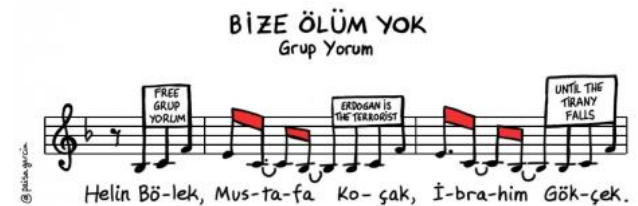
Viñeta del Paisà García

Desde el Comité de Solidaridad con los Pueblos - Interpueblos queremos mostrar nuestra solidaridad con lxs familiares y componentes de Grup Yorum. A su vez denunciamos la deriva autoritaria del estado turco y la persecución y represión hacia artistas, activistas y políticxs opositores al régimen de Erdogan y ratificamos nuestro compromiso internacionalista con sus luchas.