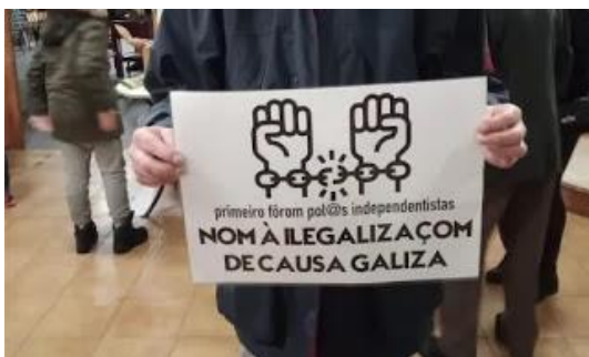
El capital MATA

Contra la burguesía en el estado español... y en cualquier parte.