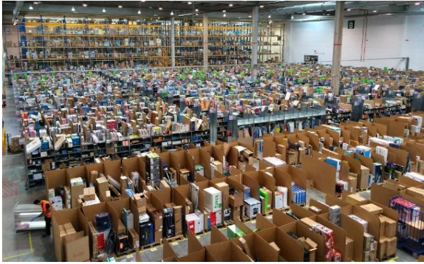
Almacén de Amazon en San Fernando de Henares.

de Amazon 'Un click para el cole' por ser "una campaña consumista que va en contra del tejido y comercio social y que sólo busca beneficiar a la propia compañía"