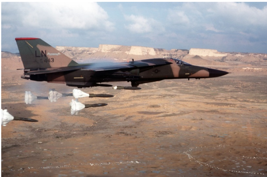
Maniobras militares en las Bardenas Reales

“Bardenas – recuerdan desde la Asamblea Anti polígono -, es el lugar donde probar bombas y maniobras que se usan en guerras que provocan miedo, miseria, hambre, refugiados. Porque ese hermoso paraje, ese singular Parque natural y Reserva de la Biosfera, está supeditado al ‘interés superior de la Defensa’. Así lo decretó el Gobierno Aznar, y así lo mantiene el actual Gobierno español”.