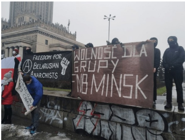
Foto: protesta de solidaridad con FNB Minsk en Varsovia, Polonia. A través de Anarchistyczny Czarny Krzyż (ABC). Fuente: https://freedomnews.org.uk/belarus-food-not-bombs-activists-receive-prison-sentences-for-giving-away-food/ Traducción: A. Padalecki

En total, cuatro activistas de la FNB fueron condenados a 15 días de prisión. Al mismo tiempo se condenó a dos paramédicos callejeros que prestaban atención médica. Además, dos personas más han visto sus casos remitidos para revisión, sin embargo, esperarán el resultado tras las rejas.